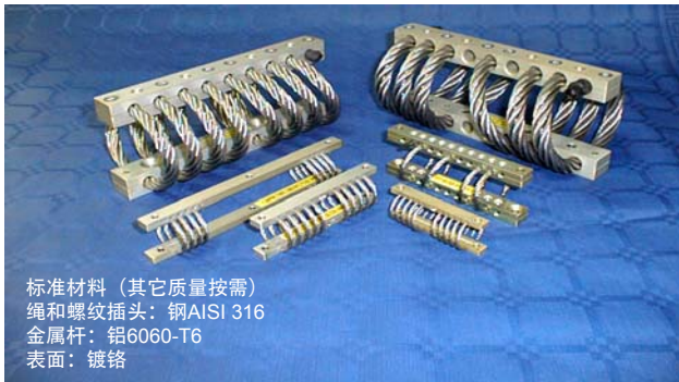
A10系列- 标准系列尺寸 冲压设计